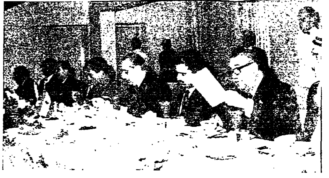
جانب من جلسة الوزراء التي اقامها الرئيس خلو تكريماً لجلالة المسيح